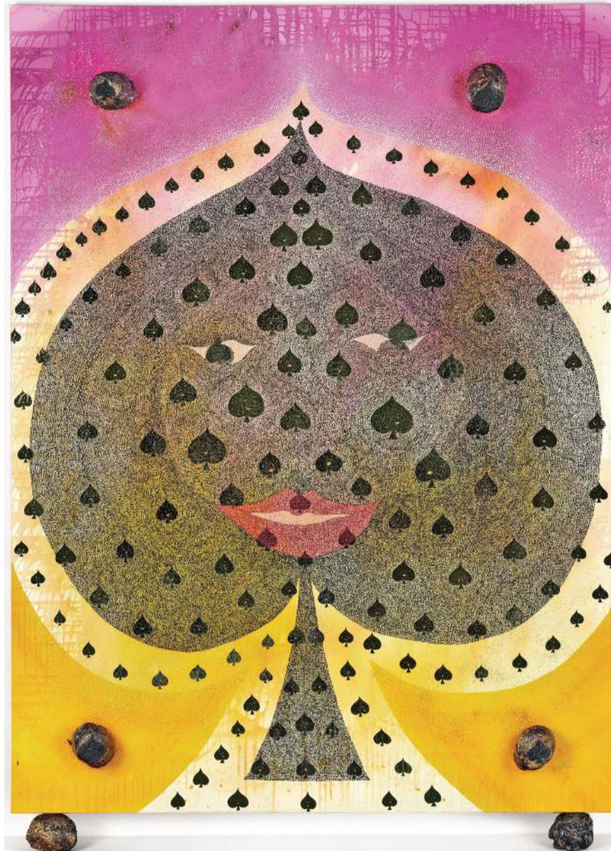
Das Spitzenlos steht auf Elefantendung: Chris Ofilis knapp zweieinhalb Meter hohe Arbeit „Trump“ von 1998, Taxe 300.000 bis 500.000 Euro

Dank seiner Repräsentanzen in Mailand und Rom bringt das Dorotheum wieder starke italienische Kunstwerke zum Aufruf. Besonders sticht Emilio Vedovas gestisch-kraftvolles Gemälde „Emerging '83“ hervor, das er dem deutschen Architekten Bruno Taut widmete. Der Katalog verweist auf Parallelen zwischen einer breitpinnig gemalten Spitzform und Tauts Glashauspavillon von 1914. Das nahezu quadratische Großformat wird auf 180.000 bis 250.000 Euro geschätzt. Die Mailänder Nachkriegsavantgarde zeigt sich experimentierfreudig: Lucio Fontanas polychrome Terrakotta „Crocifissione“ von 1957 setzt goldene Farbakzente (100.000/150.000). Im selben Jahr schuf